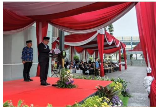
Hari upacara bela negara ke-77 tahun 2025

18. Meningkatkan Pemahaman tentang berbagai kebersamaan, partisipasi, dan pengembangan ormas untuk menciptakan situasi dan kondisi yang kondusif, sehingga stabilitas nasional dan situasi sosial masyarakat selalu terjaga, dan meningkatkan toleransi serta kerukunan didalam kehidupan beragama dan bermasyarakat, selain itu memberikan pemahaman tentang pentingnya ormas tertib berorganisasi dan tertib kelengkapan administrasi.