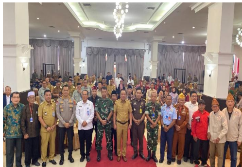
Sosialisasi Tokoh Adat dan Tokoh Masyarakat dengan Tema “ Peran Tokoh Adat dan Tokoh Masyarakat Dalam Menjaga Ketahanan Bangsa”.

tim pengawasan terpadu Ormas menjadi suatu urgensi yang tidak dapat diabaikan.