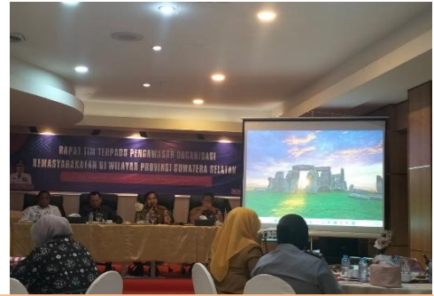
Rapat Tim Terpadu Pengawasan Organisasi Kemasyarakatan di Wilayah Provinsi Sumsel Tahun 2025