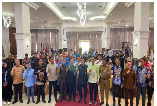
Sosialisasi Legalitas dan Keberadaan Ormas yang Aktif dan Tidak Aktif di Provinsi Sumsel