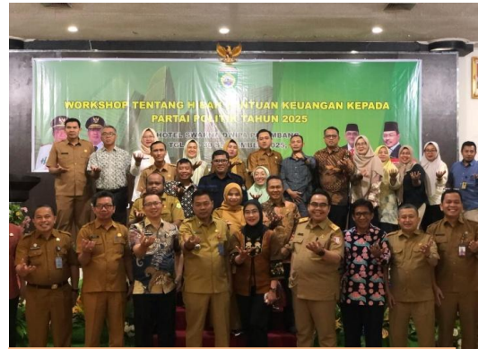
Workshop Tentang Hibah Bantuan Keuangan Partai Politik (29-30 September 2025)