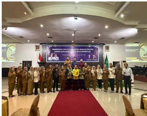
Pendidikan Politik dan Etika Budaya Politik Tahun 2025 Bagi Siswa/i