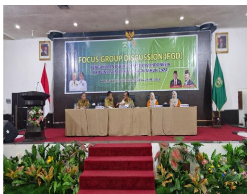
FGD IDI Tahun 2025 (27 Mei 2025)