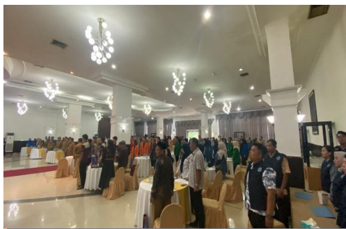
Sosialisasi Bahaya Narkoba dengan Tema “ Peran Aktif Generasi Muda dalam Membangun Karakter Anak Muda Sumsel Anti Narkoba

18. Meningkatkan Pemahaman tentang berbagai kebersamaan, partisipasi, dan pengembangan ormas untuk menciptakan situasi dan kondisi yang kondusif, sehingga stabilitas nasional dan situasi sosial masyarakat selalu terjaga, dan meningkatkan toleransi serta kerukunan didalam kehidupan beragama dan bermasyarakat, selain itu memberikan pemahaman tentang pentingnya ormas tertib berorganisasi dan tertib kelengkapan administrasi.