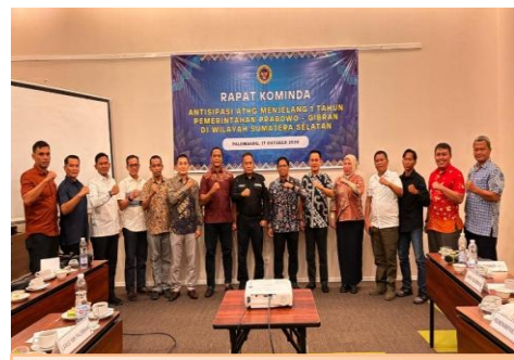
Rapat KOMINDA Antisipasi ATHG Menjelang 1 Tahun Pemerintahan Prabowo-Gibran di Wilayah Sumsel