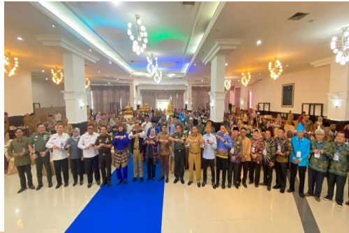
Pelantikan Forum Pembauran Kebangsaan (FPK)

permasalahan atau gangguan yang mungkin timbul ditengah masyarakat karena forum ini merupakan wadah informasi, komunikasi, konsultasi dari berbagai unsur terkait dalam rangka mewujudkan sinergitas dan harmonisasi dalam menghadapi dan mengatasi permasalahan yang terjadi dan berkembang dalam kehidupan berbangsa dan bernegara.