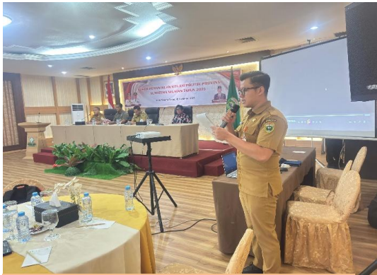
Rakor Pemantauan Situasi Politik Provinsi Sumsel