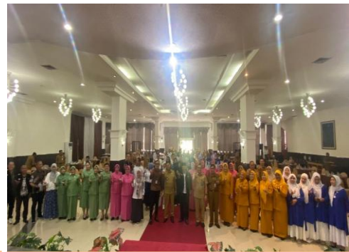
Sosialisasi Ketahanan Ekonomi Dengan Tema “ Peran Pemerintah, Swasta dan Masyarakat dalam Membangun Ketahanan Ekonomi di Sumsel