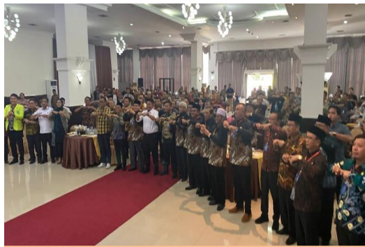
Rapat Koordinasi Kerukunan Umat Beragama dengan Tema “ Memperkuat Kerukunan Membangun Perdamaian Menuju Indonesia Emas 2045