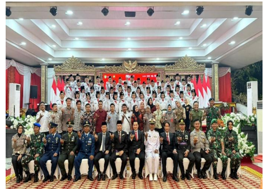
Latihan Paskibraka Tahun 2025 (29 Juli – 17 Agustus 2025)